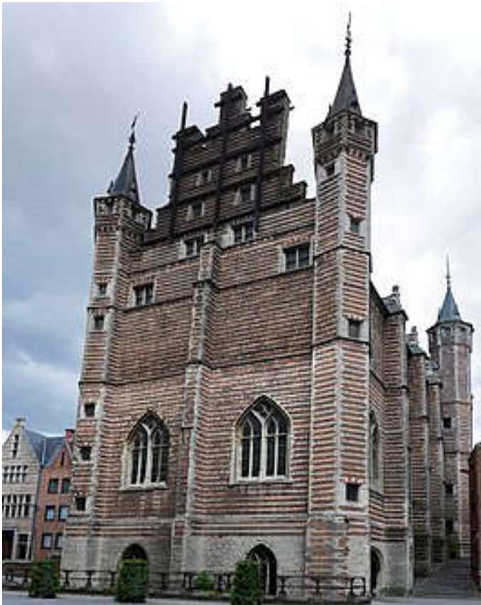
foto: het Vleeshuis in Antwerpen