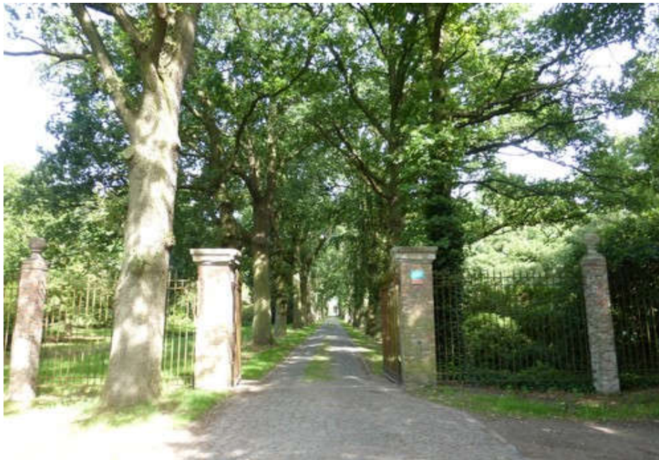
Foto: de toegangs- poort van Hemelrijk